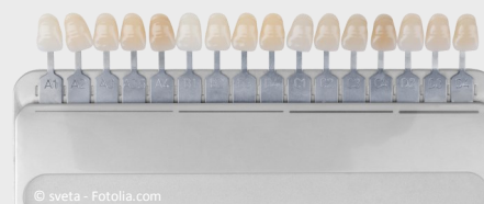
Farbskala zur Bleaching-Kontrolle

Wie schnell die Zähne wieder etwas dunkler werden, hängt davon ab, wie Sie sich ernähren und welche Genussmittel Sie konsumieren: Wenn Sie viel Tee, Kaffee, Rotwein oder Cola trinken und rauchen, werden sie schneller wieder dunkler. Wenn nicht, bleiben sie jahrelang hell.